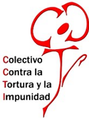
Colectivo Contra la Tortura y la Impunidad