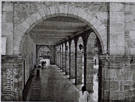
EN TEZOATLÁN, una empresa minera se pretende apoderar de más de 11 mil 900 hectáreas.

Cabe destacar que los jóvenes indígenas que se reunieron el pasado 7 de abril, destacaron que en el caso de San Jerónimo Silcayoapilla son 20 mil hectáreas de tierra las que se pretenden explotar, mientras que en Tezoatlán de Segura y Luna son 11 mil 927 hectáreas las que estarán a cargo de la empresa Carbón Mexicano S.A de C.V. y en donde los recursos naturales con los que cuenta esta demarcación quedarán devastados; de la misma manera exigen la cancelación inmediata de la concesión de las 924 hectáreas de los Bienes Comunales en Santa Catarina Yutandú, Tezoatlán.